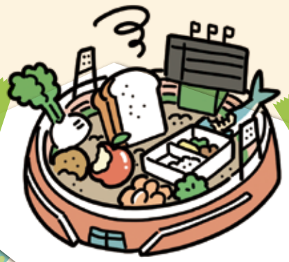
広島市の食品ロス量は、約3.2万トン（令和3年度推計）。マダガスダミアム約1.3杯分に相当します。